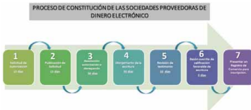
Figura N°4: Proceso de Constitución de las Sociedades Proveedoras de Dinero Electrónico