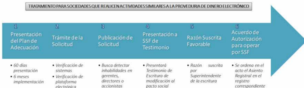
Figura N°6: Tratamiento de las Sociedades que realicen Actividades similares a la Proveeduría de Dinero Electrónico