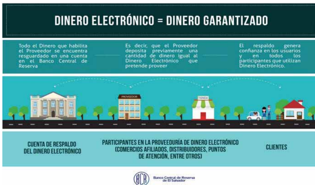
Figura N°7: Respaldo del Dinero Electrónico en el Banco Central de Reserva