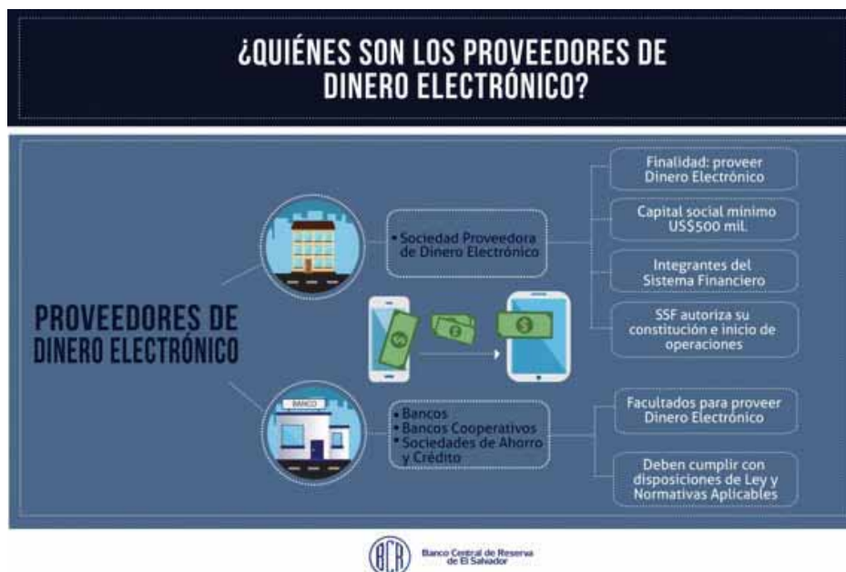
Figura N°3: Proveedores de Dinero Electrónico.

Diseño: Departamento de Comunicaciones BCR